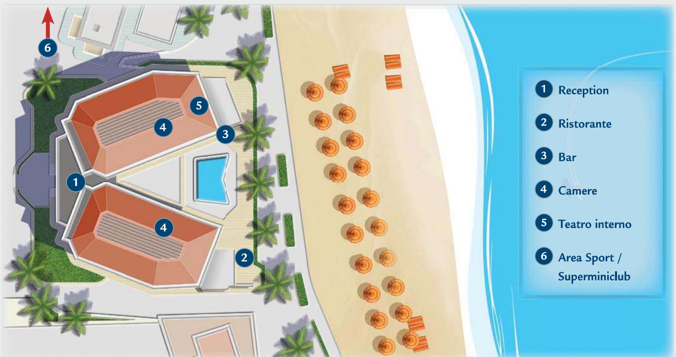
TABELLA PREZZI pag. 341