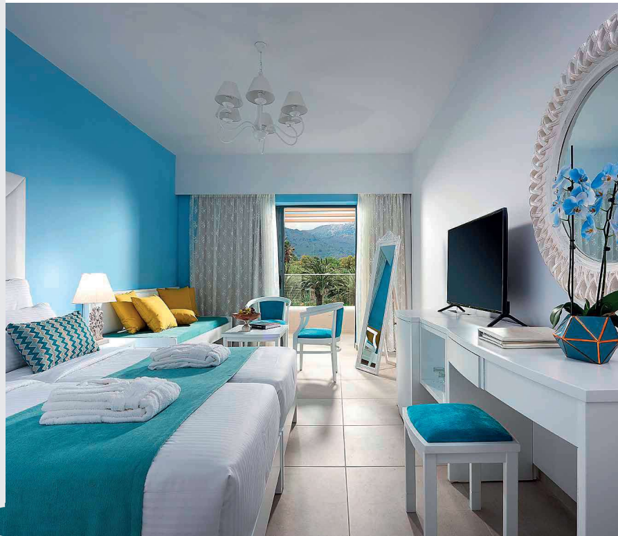
Junior suite fronte mare

Per tutti i dettagli consulta le pagine finali.