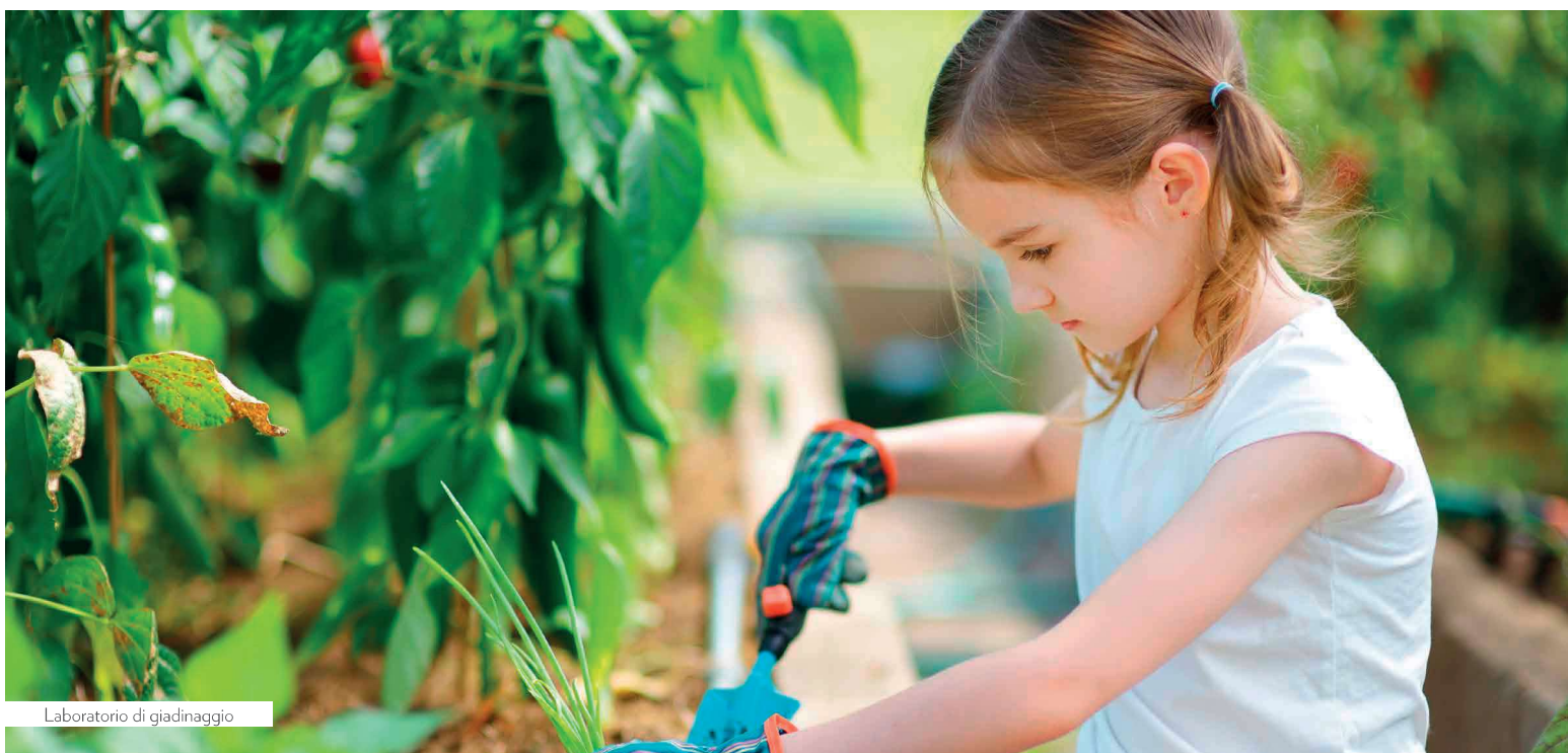
Laboratorio di giardinaggio